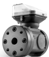
QUANTOMETER MECHANISCH MQM DN25