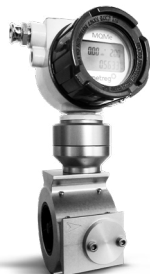
QUANTOMETER ELEKTRONISCH MQMe DN50