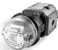
DREHKOLBENGASZÄHLER MRM DN25 G10