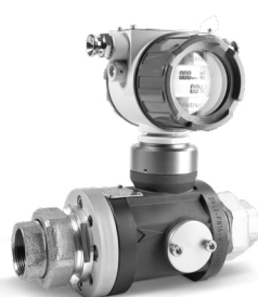
QUANTOMETER ELEKTRONISCH MQMe DN25