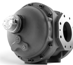
DREHKOLBENGASZÄHLER MRM DN150 G400