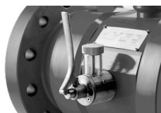
TURBINENRADGASZÄHLER mit Ölpumpe MTM DN150