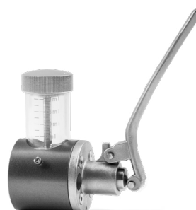
ÖLPUMPE zur Lagerschmierung (optional)