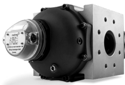
DREHKOLBENGASZÄHLER MRM DN80 G160