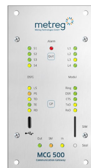
MODBUS-DSFG-GATEWAY MIT LTE MODUL MCG 500 19" KOMPAKT