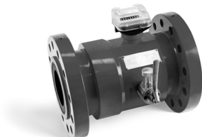
TURBINENRADGASZÄHLER MTM DN150 G400 PN100