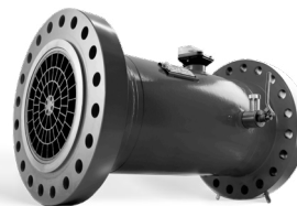
TURBINENRADGASZÄHLER MTM DN300 G2500 PN100