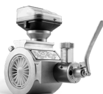
QUANTOMETER MECHANISCH mit Ölpumpe MQM DN80